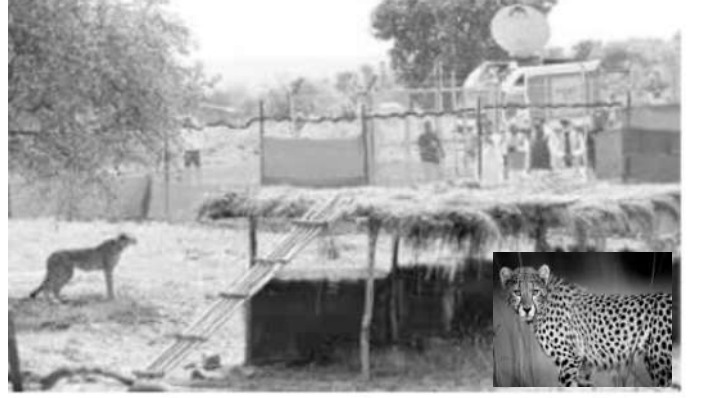
▲ தற்போது கண்காணிப்பு வளையத்தில் சிவிங்கி